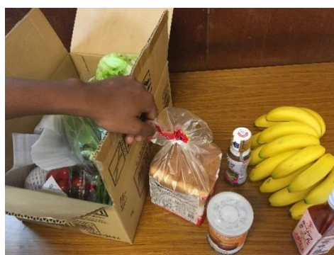
↑ 地域の他団体や市民の皆さんからの温かい気持ちとともに渡す食料