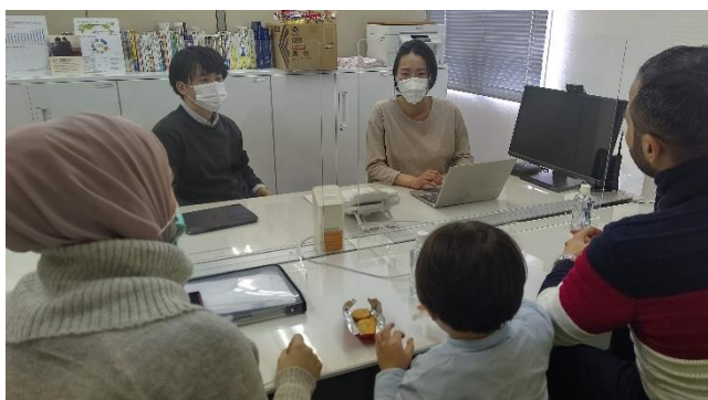
↑ 支援の入り口となる重要な聴き取り