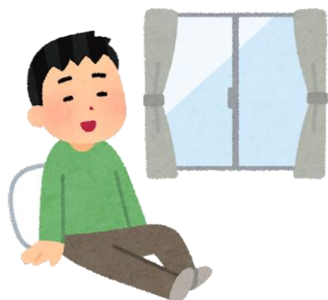
↑ 住居は安心した生活に不可欠